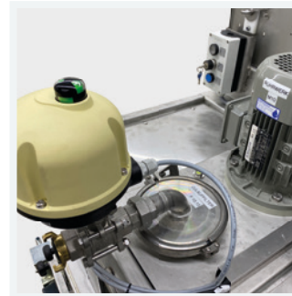
Schmutzwassertank mit integriertem Zulaufgrobfilter (<5 mm) sowie Rührvorrichtung

600 liter waste water tank with integrated inlet stainless steel filter (<5 mm) as well as an integrated mixing device and optional tubular heating element; storage tank and dosing station for flocculants, optionally disinfectants, biocides and/or defoamers; mixing unit and reactor for the separation of solids/liquids; belt filter with tear-resistant filter fleece (60 µm) incl. collection tank with float switch for continuous dewatering of wastewater and filtration of microplastics. 300-liter fresh water tank as additional tank for cleaning the SMC2400 or for the supply of fresh water for the operation of the cleaning unit; 100 liter clear water tank with discharge option to sewer or return to waste water tank; metering and stainless steel feed pumps for particle size up to 10 mm; sensors for checking turbidity, flow and fill levels; central outdoor control box with display for control of all pumps, valves, belt filter as well as retrieval and storage of sensor readings; tanks and all pipes as well as pumps are made in stainless steel (1.4301/AISI 304).