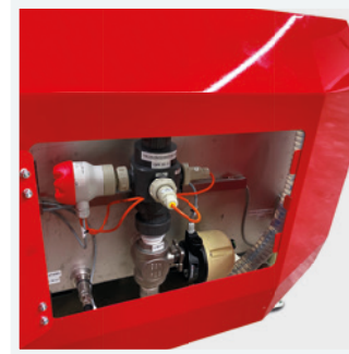
Sensorik zur Überprüfung von Trübung, Durchfluss und Füllständen

Central switch box with display for controlling all pumps etc.