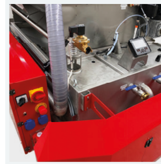
Zentraler Schaltkasten mit Display zur Ansteuerung sämtlicher Pumpen etc.

Belt filter with tear-resistant filter fleece (60 µm) including collecting container with float switch