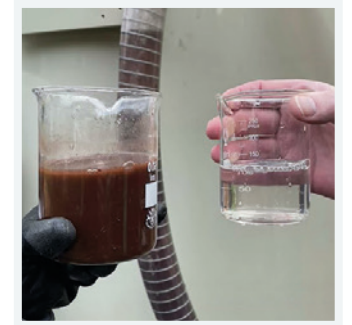
Schmutzwasser im Vergleich: links vor, rechts nach der Reinigung

Sensors for checking turbidity, flow and fill levels