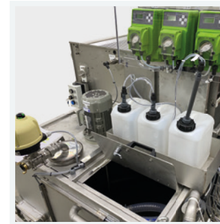
Vorratsbehälter und Dosierstation für Flockungsmittel, optional auch zur Dosierung von Reinigungsverstärkern usw.

Waste water tank with integrated entry inlet filter (<5 mm) as well as stirring device