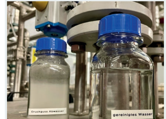
Vergleich Druckguss Abwasser zu gereinigtem Wasser