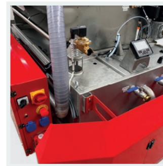
Zentraler Schaltkasten mit Display zur Ansteuerung sämtlicher Pumpen etc.

Belt filter with tear-resistant filter fleece (60 µm) including collecting container with float switch