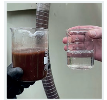
Schmutzwasser im Vergleich: links vor, rechts nach der Reinigung

Sensors for checking turbidity, flow and fill levels