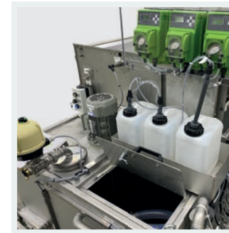
Vorratsbehälter und Dosierstation für Flockungsmittel, optional auch zur Dosierung von Reinigungsverstärkern usw.

Waste water tank with integrated entry inlet filter (<5 mm) as well as stirring device