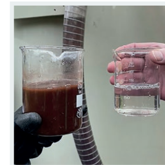
Schmutzwasser im Vergleich: links vor, rechts nach der Reinigung