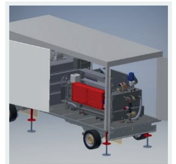
OPTION: smartLevelSystem Elektrisches System zur automatischen Ausrichtung des Anhängers inkl. Batterie usw. Traglast 2t je Stützen (8t gesamt)

Gewicht 3.500 kg zulässiges Gesamtgewicht