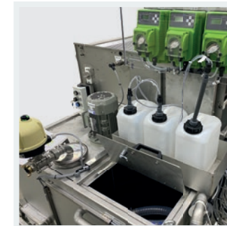
Vorratsbehälter und Dosierstation für Flockungsmittel, optional auch zur Dosierung von Reinigungsverstärkern usw.